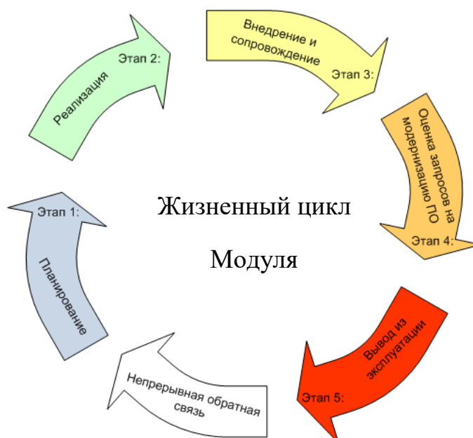
Рисунок 1 – Жизненный цикл Модуля

2.1 Жизненный цикл Модуля представлена на рисунке 1.